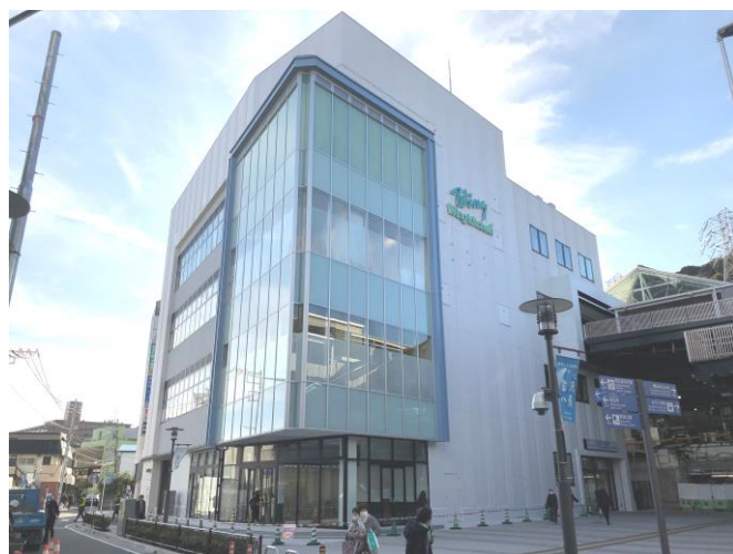
ウイングキッチン金沢八景外観